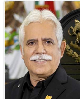
DIP. VICENTE JAVIER VERASTEGUI OSTOSVOCAL